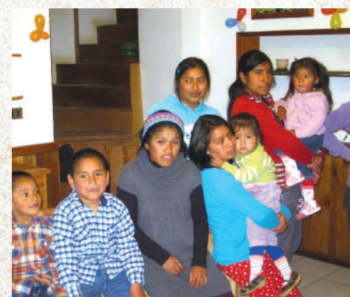
Interno della Casa San Domenico Savio.