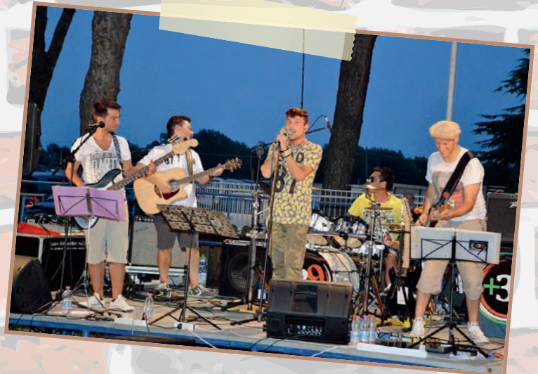
Bravi, proprio bravi i +39: per l'ottimo repertorio, per il loro talento, per la loro genuina passione.