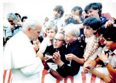
In Piazza San Pietro a Roma, Don Guido e Padre Paolino Tomaino attirano l'attenzione di Papa Giovanni Paolo II e gli parlano della difficile situazione dell'Uganda e del progetto di costruire una Scuola superiore.