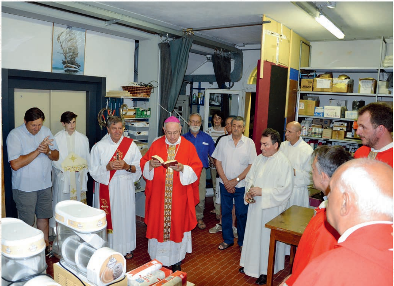
Al termine della concelebrazione eucaristica, il Vescovo emerito Stagni benedice la nuova cucina, che verrà inaugurata il giorno seguente con l'apertura dello stand gastronomico di “E...state in festa”.

hanno fatto sì che questi interventi venissero compiuti nei tempi richiesti e nel migliore dei modi. Non facciamo nomi, ma coloro che abbiamo nel cuore mentre scriviamo sapranno riconoscersi in queste righe, ne siamo certi! A loro tanta sincera gratitudine, perché... senza di voi non ce l'avremmo fatta! L'impegno economico richiesto al “Partecipa anche tu!” per questi interventi non va in alcun modo a interferire con la scelta di lasciare intatte le offerte destinate alle missioni: neppure un centesimo viene tolto dalle vostre offerte! Questa scelta, che è un elemento chiave dello stile con cui operiamo, voluta dai fondatori e alla quale non siamo mai venuti meno, continuerà ad essere onorata, nel rispetto dell'intenzione dei benefattori e delle attese dei fratelli al cui fianco il “Partecipa anche tu!” cammina.